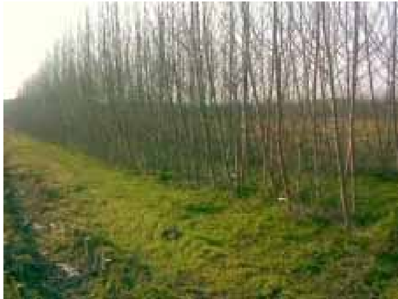
Peupliers âgés de deux ans