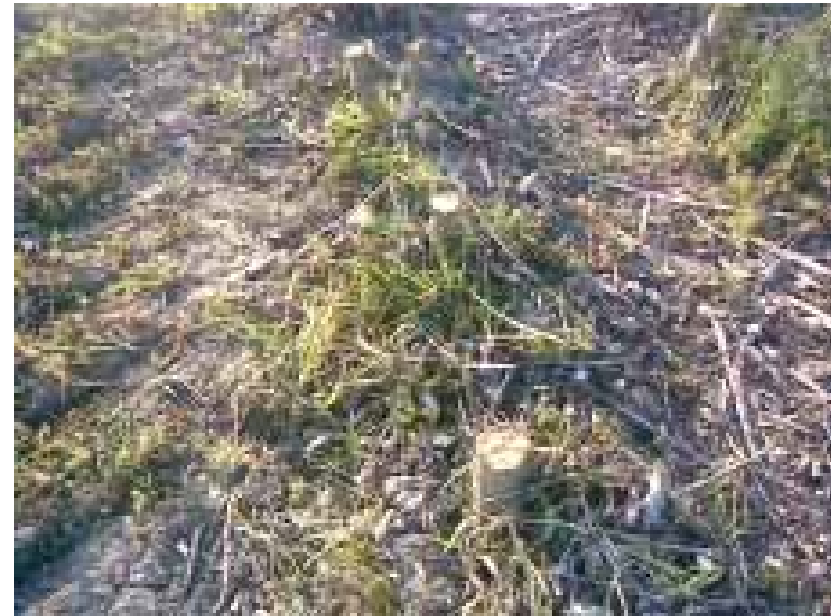
Après la récolte